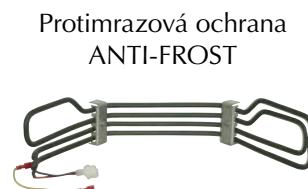
Protimrazová ochrana ANTI-FROST