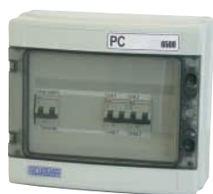
PC NEB 6500

PCE – NEB 6500 - Řídící panel řízený prostorovým hygrostatem, situovaný ve vodotěsné kabině spolu s elektronickým hygrostatem, s digitálním displejem pro čtení stupně RV. Pracuje spolu s jakýmkoliv čidlem na trhu. Může řídit dva NEB 6500. Možnost Provozu ZAP/VYP. Čidlo není součástí dodávky. Protimrazová ochrana ANTI-FROST 70W krytý elektrický ohřívač