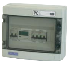
PCE NEB 6500