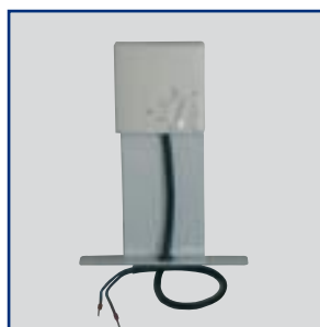
Sestava pro uchycení hygrostatu