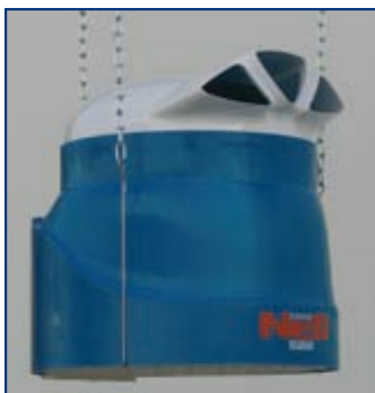
Závěsné provedení MINI NEB