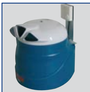
MINI NEB s hygrostatem

Sada s hygrostatem pro připevnění k přístroji je možné dodat na vyžádání. Skládá se z mechanického hygrostatu pozinkovaného držáku a připojovacích kabelů. Může být připevněna přímo na přístroj MINI NEB.